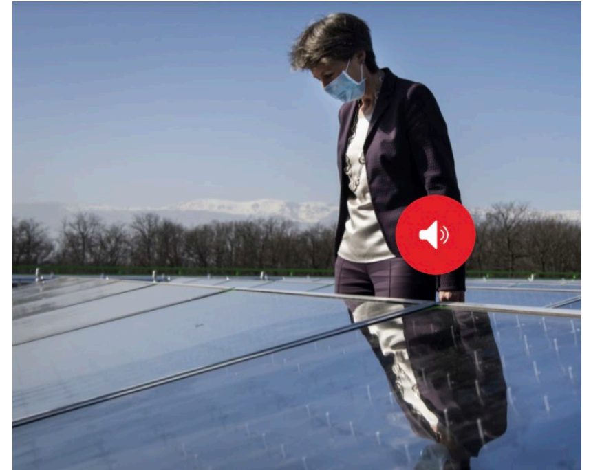
Simonetta Sommaruga, Energie- und Umweltministerin